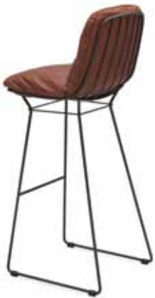
LEYASOL BARSTOOL HIGH