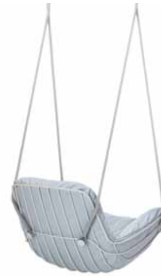
LEYASOL SWING SEAT