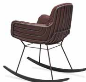
LEYASOL ROCKING ARMCHAIR HIGH