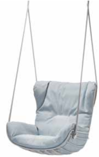
LEYASOL WINGBACK SWING SEAT