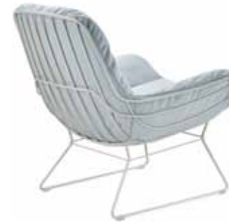
LEYASOL LOUNGE CHAIR