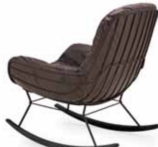
LEYASOL ROCKING LOUNGE CHAIR