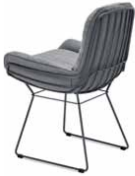
LEYASOL ARMCHAIR LOW