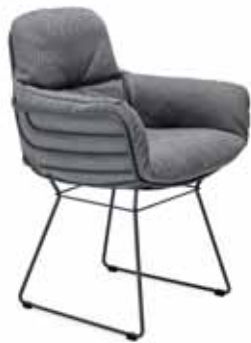
LEYASOL ARMCHAIR HIGH