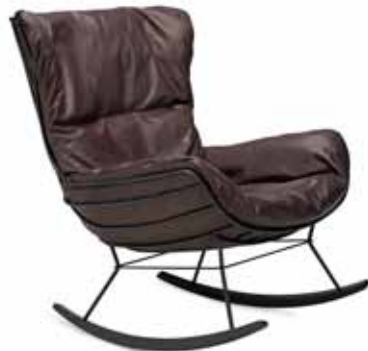
LEYASOL ROCKING WINGBACK CHAIR